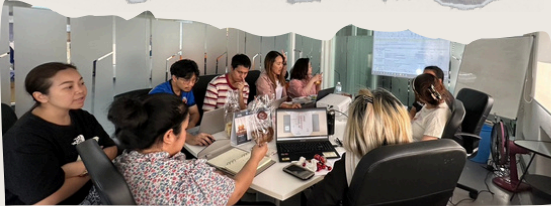
“ภาพรวมของทีมงานหลังจบงาน Wild Animal Rescue Trail Run 2024: Episode 1 Rescue Gibbon และ ภาพระหว่างการประชุมงานข้างต้น”